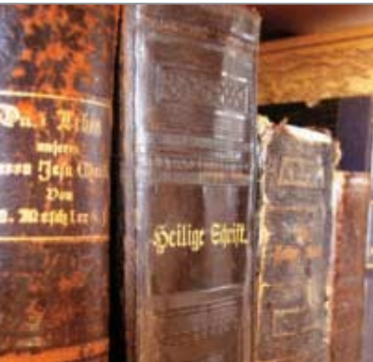
Die Bibel: Eine Sammlung von vielen Büchern.

„Es wohnten aber in Jerusalem Juden, die waren gottesfürchtige Männer aus allen Völkern unter dem Himmel. Als nun dieses Brausen geschah, kam die Menge zusammen und wurde bestürzt; denn ein jeder hörte sie in seiner eigenen Sprache reden. Sie entsetzten sich aber, verwunderten sich und sprachen: Siehe, sind nicht diese alle, die da reden, aus Galiläa? Wie hören wir denn jeder seine eigene Muttersprache? ... Juden und Judengenossen, Kreter und Araber: wir hören sie in unsern Sprachen von den großen Taten Gottes reden.“