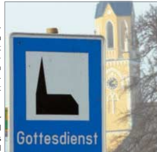
Am Ortseingang nicht zu übersehen: Menschen sind zum Gottesdienst eingeladen.

Bei Eheschließungen zwischen Christen und Muslimen kann in der Evangelischen Kirche von Westfalen auf Wunsch des Paares und vor allem mit dem Einverständnis des nicht-christlichen Partners ein „Gottesdienst anlässlich der Eheschließung von Christen und Nichtchristen“ stattfinden. Dazu liegt eine entsprechende Arbeits-hilfe der Evangelischen Kirche von Westfalen vor. Ein Kind aus einer ge-mischt religiösen Ehe kann, wenn ein Elternteil evangelisch ist, getauft und konfirmiert werden.