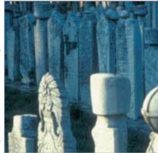
Zur islamischen Bestattungskultur gehören meist auch Grabsteine mit besonderer Formensprache.

Im respektvollen und hilfreichen Umgang mit Muslimen bringen Christen zum Ausdruck, dass ihrer Glaubensüberzeugung nach das erlösende Handeln Gottes nicht nur ihnen, sondern allen Menschen gilt. Es ist daher eine besondere Aufgabe von Christen, dabei mitzuhelfen, dass Muslimen die Bestattung ihrer Angehörigen in Würde ermöglicht wird.