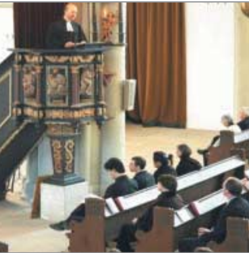
Die Predigt ist Auslegung des Wortes Gottes und steht im Zentrum des evangelischen Gottesdienstes.

Zum Heimischwerden von Muslimen in unserem Lande gehört das Erlernen der deutschen Sprache. Je besser jemand Deutsch sprechen kann, umso stärker ist er oder sie auch in das Alltagsleben und die Alltagsvollzüge unseres Landes integriert. Umso selbstverständlicher besteht auch die Möglichkeit, am Dialog zwischen den Kulturen und den Religionen teilzunehmen. Eine Sprache zu erlernen bedeutet mehr, als nur fremde Vokabeln zu beherrschen. Sprachvermittlung ist auch immer eine Vermittlung von Kultur. Von daher ist es zu verstehen, dass es gelegentlich in muslimischen Familien zu einer besonderen Betonung des „Moslemseins“ kommt, weil es Befürchtungen gibt, im Zuge des Sprachverlustes auch kulturelle und religiöse Bezüge zu verlieren.