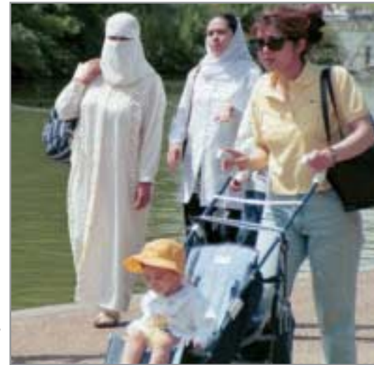
Zur Religionsfreiheit gehört es auch, seine Frömmigkeit öffentlich zeigen zu können.

Bei dem Ehevertrag, der nach islamischer Tradition bei jeder Eheschließung, auch bei einer christlich-islamischen Ehe, unterzeichnet wird, kommt es darauf an, diesen Vertrag nicht nur vor einem Notar, sondern auch vor einem Imam abzuschließen, dessen Autorität im Heimatland des Bräutigams anerkannt ist und die Rechtsgültigkeit der Ehe dort garantiert. Dies ist dann von besonderer Bedeutung, wenn das Ehepaar sich längere Zeit im Heimatland des Mannes aufhält oder beabsichtigt, auf Dauer dort zu leben. Die Ehefrau sollte darauf bestehen, dass in den Vertrag die Verpflichtung zur Monogamie aufgenommen wird, das freie Verfügungsrecht über den eige-