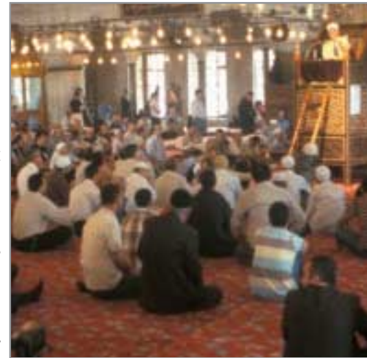
Der Besuch der Freitagspredigt ist eine Pflicht für alle muslimischen Männer.

Bei der Integration in unsere Gesellschaft geht es nicht um die Assimilation von Muslimen. Niemand darf den anderen vorschreiben, genauso zu leben, wie er oder sie selber lebt. So stellt das Zusammenleben mit Muslimen auch Herausforderungen an die heimische Bevölkerung. Sie ist aufgerufen, sich um Verständnis und Verständigung zu bemühen, auch bei Fremdheit Toleranz zu üben und Hindernisse für ein achtungsvolles Miteinander aus dem Weg zu räumen.