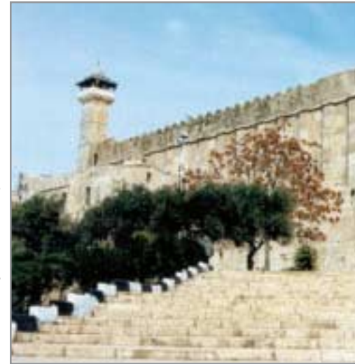
Abraham und Sara sind nach biblischer Überlieferung in Hebron begraben.

Nach islamischer Überzeugung hat Mohammed diesen wahren Dienst am wahren Gott wiederhergestellt; ob die Berufung auf Abraham echt ist oder nicht, zeigt sich für Muslime daher auch in der Anerkennung des Prophetentums Mohammeds. Die wichtigsten muslimischen Feste (Ramadan und Opferfest) beziehen